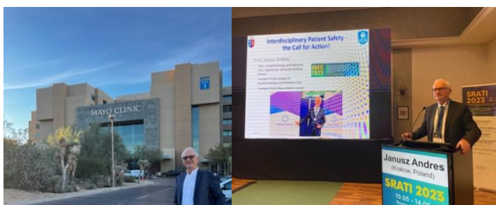
Zdjęcie z wizyta w Mayo Clinic (USA) oraz z wykładu na Kongresie Anestezjologów w Sinaia (Rumunia)

Bezpieczeństwo pacjenta w anestezjologii pozostało wiodącym tematem w czasie czerwcowego Kongresu Europejskiego Towarzystwa Anestezjologii i Intensywnej Terapii (ESAIC) w Glasgow z udziałem delegacji Amerykańskiego Towarzystwa Anestezjologów. Możemy być dumni, że to nasze środowisko po obu stronach Atlantyku należy do awangardy idei bezpieczeństwa pacjenta i nadaje kierunek bezpiecznym rozwiązaniom w ochronie zdrowia. O transatlantyckich aspektach bezpieczeństwa pacjenta mogłem się osobiście przekonać w czasie wizyty w Mayo Clinic w Phoenix.